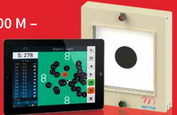
Darstellungen nicht maßstabsgetreu.

Die erprobte Technik durch Infrarot misst den „reinen Treffer“ auf der gesamten Fläche